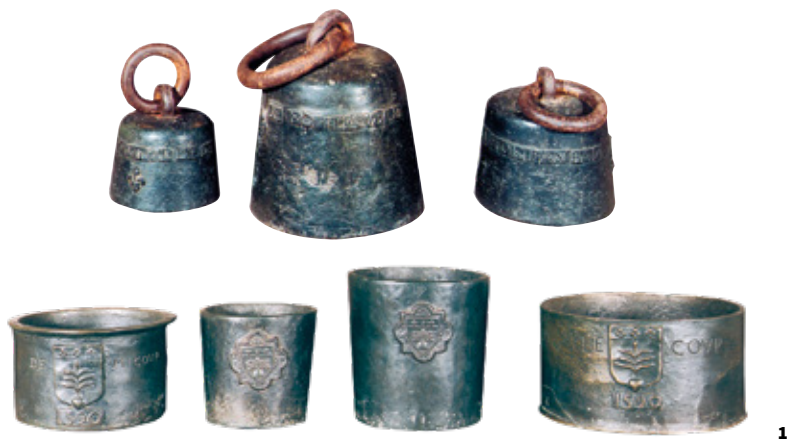
1. Poids et mesures 2. Escalier à vis, 17 place Nationale 3. Clé de voûte, couvert sud