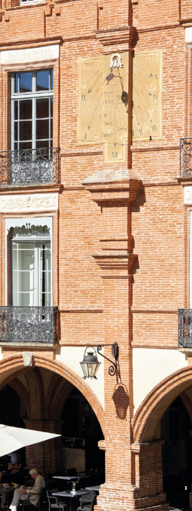
1. Cadran solaire, couvert nord © D. Viet